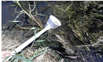
Figura 10: raccolta larvale mediante l'uso di apposito "pescalarve".

In alternativa, se le catture larvali sono effettuate con lo scopo di farle sfarfallare, raccogliere l'acqua con le larve in taniche che verranno chiuse con garze ed elastici (per consentire l'entrata di ossigeno). Una volta in laboratorio, mettere il contenuto delle taniche in vaschette coperte da reti a maglie sottili e aspettare che le larve sfarfallino. Una volta sfarfallate, aspirare gli adulti e procedere con la gestione del campione (zanzare adulte).