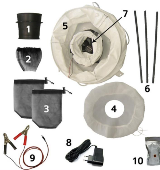
Figure 6: trappola BG-Sentinel non assemblata.

La trappola, la cui ventola può essere alimentata a corrente (220V) (8) o tramite batteria da 12V con appositi cavetti (9), deve essere posizionata a terra e deve rimanere in funzione per 24 ore dopo la sua accensione. È importante verificare la disponibilità di corrente elettrica.